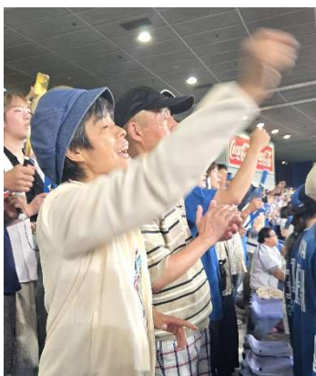
熱気に包まれた応援席で、思わず立ち立ち上がり熱い応援を送った

日本ハムが得点するたびに、みんなで万歳をした。そして周りの知らない人達と「やったー!」「いえーい!」とハイタッチやグータッチをして喜び合った。その日は9点を取ったので、合計9回も知らない人同士で大いに喜び合った。 その帰り道、メンバーさんは「前に座ってた人と友達になった」「帰るときに、(先に帰る)僕の分まで応援がんばってやって言うて来た」と笑顔で話してくれた。『これや!!』と思った。性別、障がいのあるなし、年齢など、何も問わず問われずみんな一緒に楽しんだ。大げさかも知れないけれど、偶然に居合わせた知らない人同士が溶け合う場面に立ち会えた気がした。胸ぽかぽかした。