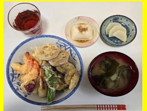
ごちそう天丼 ♡ エビ2尾・さつまいも・ナス・ちくわ・シシトウ・れんこん。お味噌汁と冷奴とべったら漬けも添えて召し上がれ！【担当職員C】