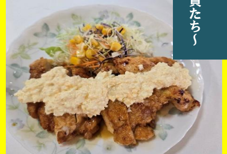
チキンなんば〜ん 🐔 【担当職員B】