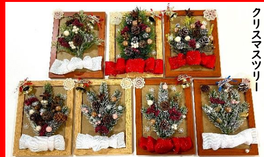
クリスマスツリー