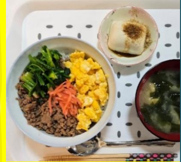
三食丼 ■■■ 【担当職員A】

スマホのカメラで読み取ってみて！吉野コスモス会のホームページの一番下のところからのどかの予定表が見れるのです！