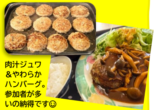
肉汁ジュワ & やわらかハンバーグ。参加者が多いの納得です☺